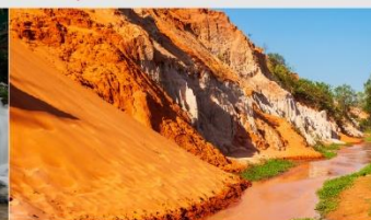
ลำธารนางฟ้า

*ทางบริษัทฯ ขอสงวนสิทธิ์ในการสลับโปรแกรมทัวร์ตามความเหมาะสมขึ้นอยู่กับสถานการณ์หน้างาน โดยคำนึงถึงผลประโยชน์ของลูกค้าเป็นสำคัญ