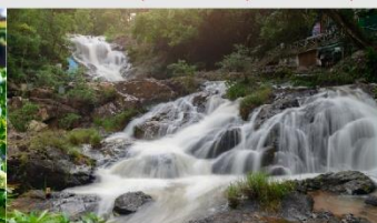
น้ำตกดาตันลา