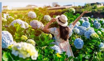
สวนดอกไฮเดรนเยีย